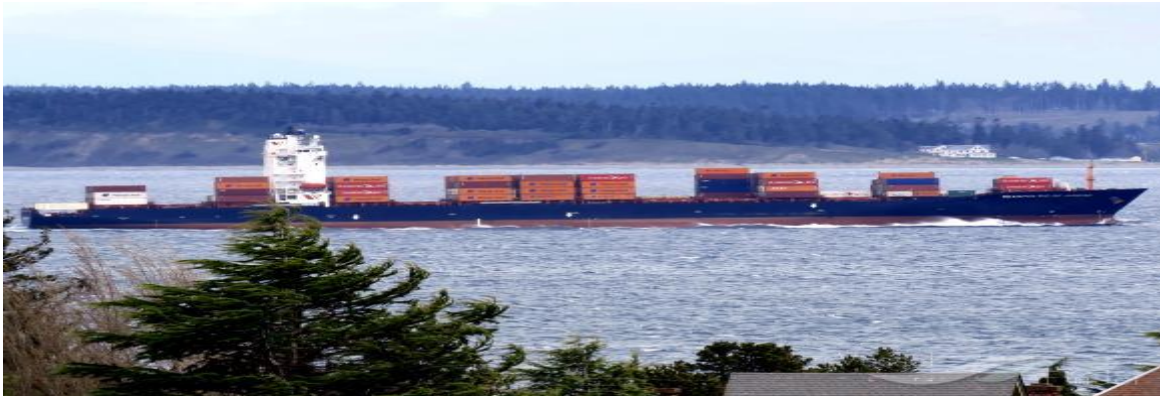
Dit is het schip.

De container is vertrokken vanuit Rotterdam op het containerschip 'Seaspan Rio de Janeiro' naar Algiers vertrokken; daar wordt de container overgeladen in containerschip 'Maersk Valencia' en komt op 21 januari 2019 aan in de haven van Banjul (te Gambia). In deze haven staat de container 2 dagen op de kade voor inklaring enz. door douaniers en gaat dan op transport naar de bedoelde school; de Nederlandse consul in Gambia gaat na waar de nood het hoogst is en besluit dan over de definitieve bestemming van uw schoolmeubilair.